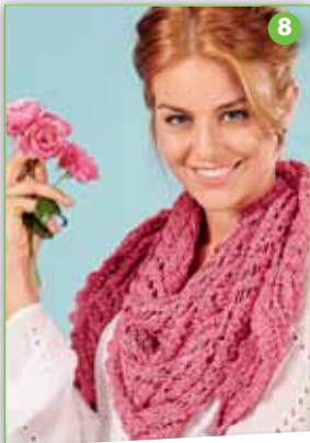
Ażurowa chusta z cekinami